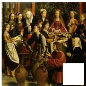
Fig. 23 – Gerard David, Les Noces de Cana. Paris, Musée du Louvre.