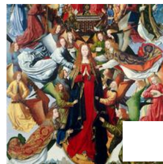
Fig. 5 – Maître de la Légende de sainte Lucie, Assomption. Washington, National Gallery of Art.