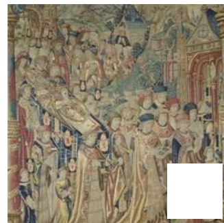
Fig. 31 – Tenture de saint Anatoile de Salins, pièce VIII, Funérailles de saint Anatoile. Paris, Musée du Louvre.