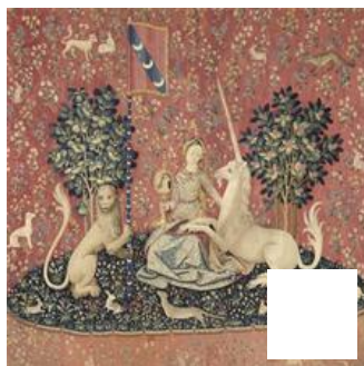
Fig. 24 – Tenture de la Dame à la Licorne : la Vue. Paris, Musée de Cluny – Musée national du Moyen Âge.