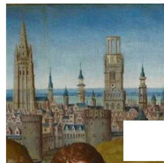
Fig. 11 – Maître de la Légende de sainte Lucie, Triptyque de la Lamentation, détail de la vue de Bruges. Minneapolis, The Minneapolis Institute of Arts.

En 1976, De Vos définira les éléments caractéristiques présents dans les peintures du maître (25). Nicole Verhaegen en avait déjà esquissées certaines, notamment la construction de la composition par plans plutôt qu'en profondeur dont résulte une certaine pauvreté dans le rendu de l'illusion spatiale. Du point de vue de l'exécution picturale, elle retient la minceur des modelés et leur opacité, la tendance au linéaire et aux surfaces silhouettées, le dessin un peu lourd et appuyé, ainsi que la fréquence des traits cernant les formes (26). De Vos établira une liste de cinq motifs considérés comme typiques du maître : l'utilisation d'une bande bleue placée à l'horizon pour séparer le ciel du paysage avec parfois la présence d'une ligne insérée