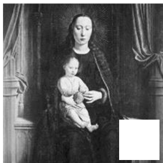
Fig. 22 – Gerard David, Retable de San Gerolamo della Cervara, partie inférieure. Gênes, Palazzo Bianco.

Un élément ayant jusqu'à ce jour peu retenu l'attention des historiens de l'art est la forte ressemblance entre la Légende de sainte Lucie et certaines tapisseries qui pourra nous conduire à envisager une autre identification. La mauvaise intégration des figures, leur écrasement et juxtaposition, l'aspect formel des compositions, leur symétrie, les traits soulignant systématiquement les contours et la présence récurrente de végétation à l'avant plan nous font directement penser à l'art de la tapisserie (68). Trop souvent ignorées, les relations entre peinture et tapisserie sont pourtant nombreuses et n'ont malheureusement jamais fait l'objet d'une étude systématique.