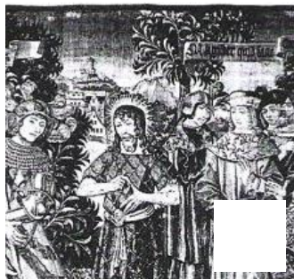
Fig. 26 – Saint Jean-Baptiste s'adressant à la foule. Glasgow, The Burrell Collection.

Deux autres tentures de chœur ont été rapprochées de l'Histoire de saint Étienne du musée de Cluny. Il s'agit de la Vie des saints