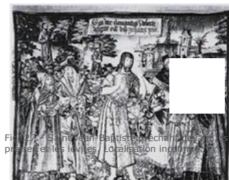
Fig. 30 – Saint Jean Baptiste, mécanisme de la tapisserie présentée en les levées. Localisation inconnue.