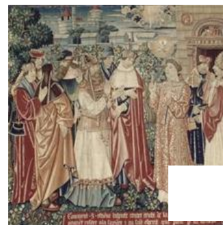
Fig. 25 – Tenture de saint Étienne, pièce II, scènes 3 et 4. Paris, Musée de Cluny – Musée national du Moyen Âge.

Gervais et Protas et de la Vie de saint Martin qui ont récemment été associées à la Vie de saint Florent , l'Histoire du saint Sacrement , la Vie de la Vierge et la Vie de saint Rémi (toutes deux à Reims), ainsi qu'à la Vie de saint Julien conservée au Mans et à la Vie de saint Jean-Baptiste anciennement à Angers mais aujourd'hui dispersée. L'ensemble de ces tentures présente des caractéristiques communes : les scènes sont séparées par des arbres ou des pilastres, certains types de figure sont repris et se répètent dans les différentes tapisseries (98), le premier plan sur lequel les personnages sont groupés est souvent couvert de feuillage, la composition semble écrasée et restitue peu l'illusion de la profondeur. Audrey Nassieu Maupas a également remarqué la représentation récurrente de certains jeux de mains spécifiques dans ces différentes tentures : « l'index de la main droite, déplié, se pose sur le pouce de la main gauche éloigné à angle droit du reste des doigts » (99). Ce geste se retrouve dans la figure de Saint Jean-Baptiste s'adressant à la foule de Glasgow (fig.26), chez un des personnages de droite de Saint Jean-Baptiste prêchant devant les prêtres et les lévites (localisation inconnue) (fig.27), ainsi que dans la tenture de la Vie de saint Rémi du musée Saint-Remi de Reims (fig.28) et dans celle de l'Histoire de saint Étienne du musée de Cluny plus particulièrement lorsque saint Étienne discute avec les docteurs de l'église (fig.29). Or,