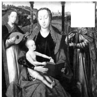
Fig. 9 – Maître de la Légende de sainte Lucie, Vierge à l'Enfant. Pittsburgh, Carnegie Museum of Art.