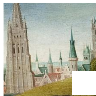
Fig. 12 – Maître de la Légende de sainte Lucie, Scènes de la vie de sainte Lucie, détail de la vue de Bruges. Bruges, église Saint-Jacques.