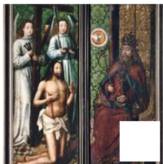
Fig. 10 – Maître de la Légende de sainte Lucie, Retable de la confrérie des têtes noires. Tallinn, Niguliste Museum.

(fig.11-12), la composition de l'arrière-plan par des coulisses d'arbres ou bien des rochers de forme pyramidale s'échelonnant jusqu'à la ligne d'horizon (fig.13), sa préférence marquée pour les pissenlits qu'il aime représenter groupés les uns en fleur et les autres avec leurs aigrettes (fig.14), la manière de peindre des groupes de petites fleurs par des ensembles de points colorés disposés en courbes particulièrement visibles dans le plan médian du Saint Jean à Patmos de Rotterdam (fig.15), et enfin, le fait de fréquemment laisser dépasser le haut des oreilles dans les chevelures des saintes (fig.16). Cependant, comme l'ont souligné plusieurs auteurs auxquels nous nous joignons, ces caractéristiques pourraient être propres aux pratiques d'un atelier et ne permettraient donc pas de définir une personnalité artistique individuelle.