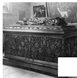
Fig. 20 – Tombeau de Marie de Bourgogne. Bruges, église Notre-Dame.