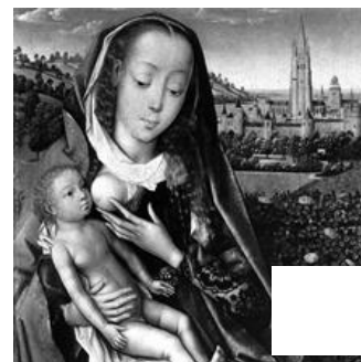
Fig. 4 – Maître de la Légende de sainte Lucie, Vierge à l'Enfant. Williamstown, Sterling and Francine Clark Institute.