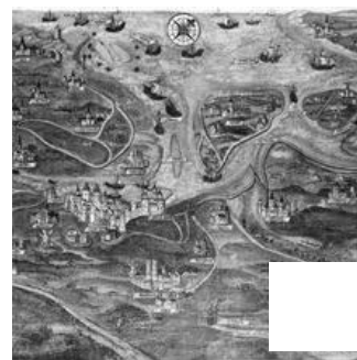
Fig. 21 – Jan de Hervy, Carte de la région du Zwin. Bruges, Groeningemuseum.