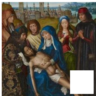
Fig. 18 – Maître de la Légende de sainte Lucie, Triptyque de la Lamentation. Minneapolis, The Minneapolis Institute of Arts.

Comme pour la plupart des peintres de cette période, son activité artistique n'est pas limitée, nous le voyons, à la peinture sur panneau, qui reste très peu connue et n'est presque jamais évoquée dans les documents d'archives publiés. Il est donc assez difficile d'affirmer sur base de ces sources son identification avec le Maître de la Légende de sainte Lucie. De plus, le Maître de la Légende de sainte Lucie se caractérise par des représentations fidèles et minutieuses des différents édifices de la ville de Bruges parmi lesquels le beffroi – ce qui a d'ailleurs permis d'établir une chronologie relative de son œuvre -. Or, lorsqu'il représente le beffroi dans le retable de saint Nicolas ou la Lamentation de Minneapolis (fig.18), ce peintre ne détaille jamais la flèche ou le saint Michel pourtant exécutés par Frans vanden Pitte. Il est donc surprenant que l'auteur de la flèche n'ait pas été plus minutieux dans sa représentation peinte alors qu'il l'est pour dépeindre l'ensemble du beffroi dans les vues urbaines de plusieurs de ses œuvres. Il est toutefois probable que celles-ci aient été réalisées par un membre de l'atelier. En effet, un examen approfondi des œuvres nous montre qu'elles sont pour la plupart exécutées au-dessus du paysage déjà peint, à un stade avancé dans la production de l'œuvre, sans que l'artiste ne prévoit de réserves. À ce stade, aucun élément déterminant ne vient donc confirmer ou infirmer cette hypothèse.