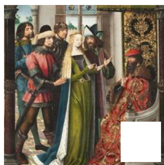
Fig. 1 – Maître de la Légende de sainte Lucie, Scènes de la vie de sainte Lucie. Bruges, église Saint-Jacques.