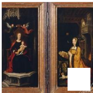
Fig. 19 – Maître de 1499 (?), Diptyque de Marguerite d'Autriche. Gand, Musée des Beaux-Arts.